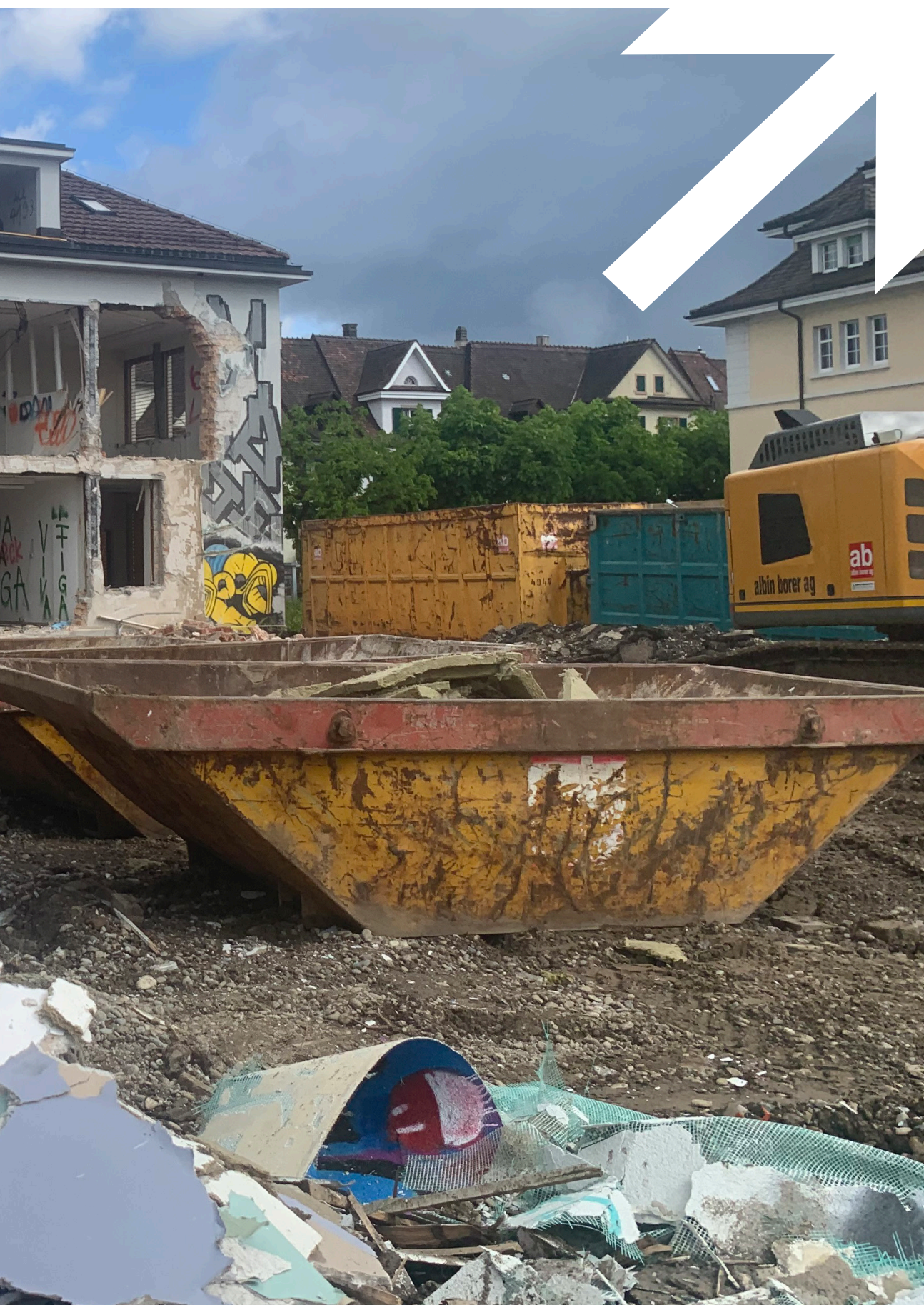
Auf dem Gebiet der ehemaligen Gemeindeverwaltung entsteht das neue Gemeindezentrum mit Bibliothek