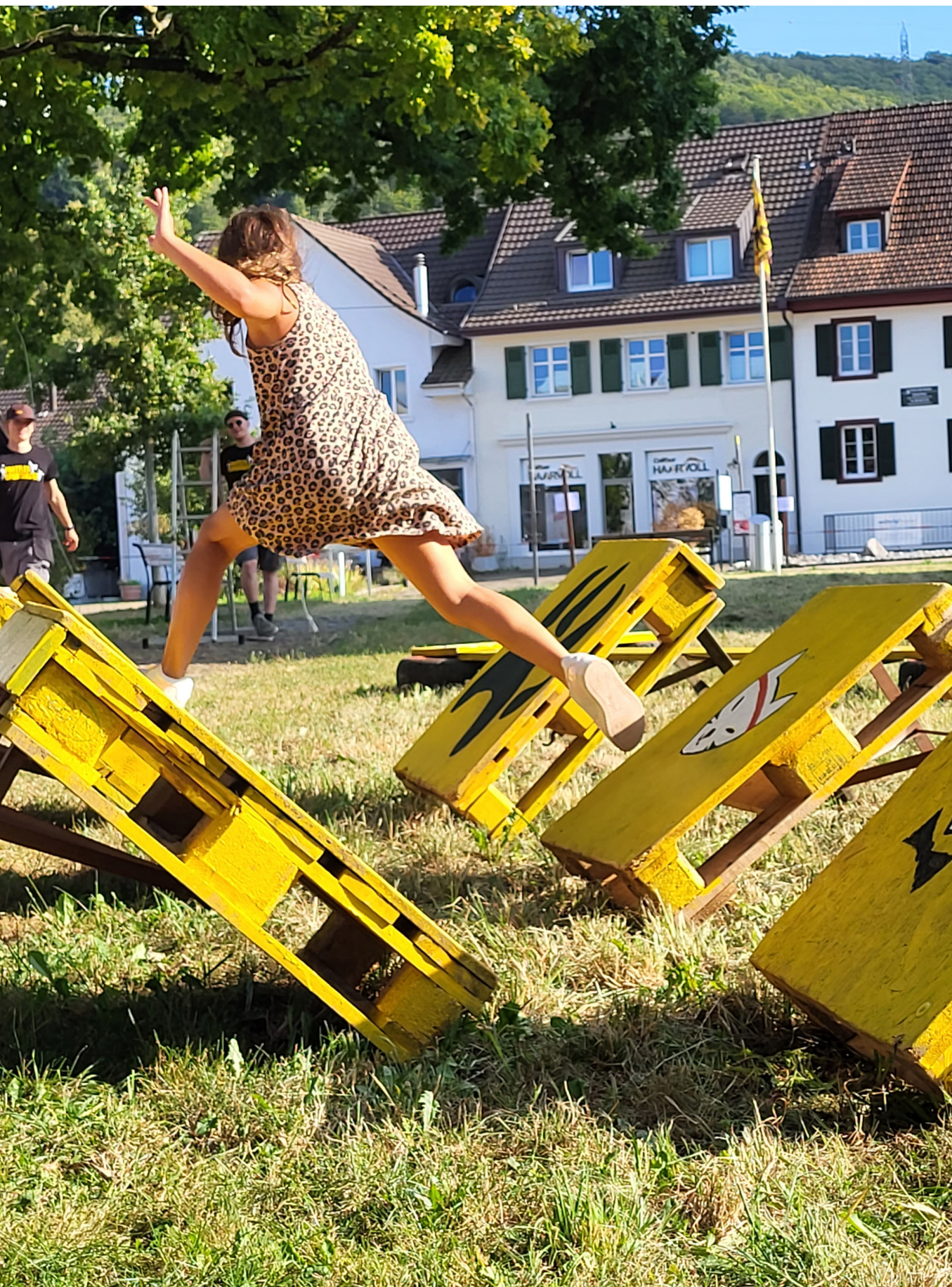
Die jährlich stattfindende Sportnacht feierte im 2024 ihr 10-Jähriges Jubiläum.