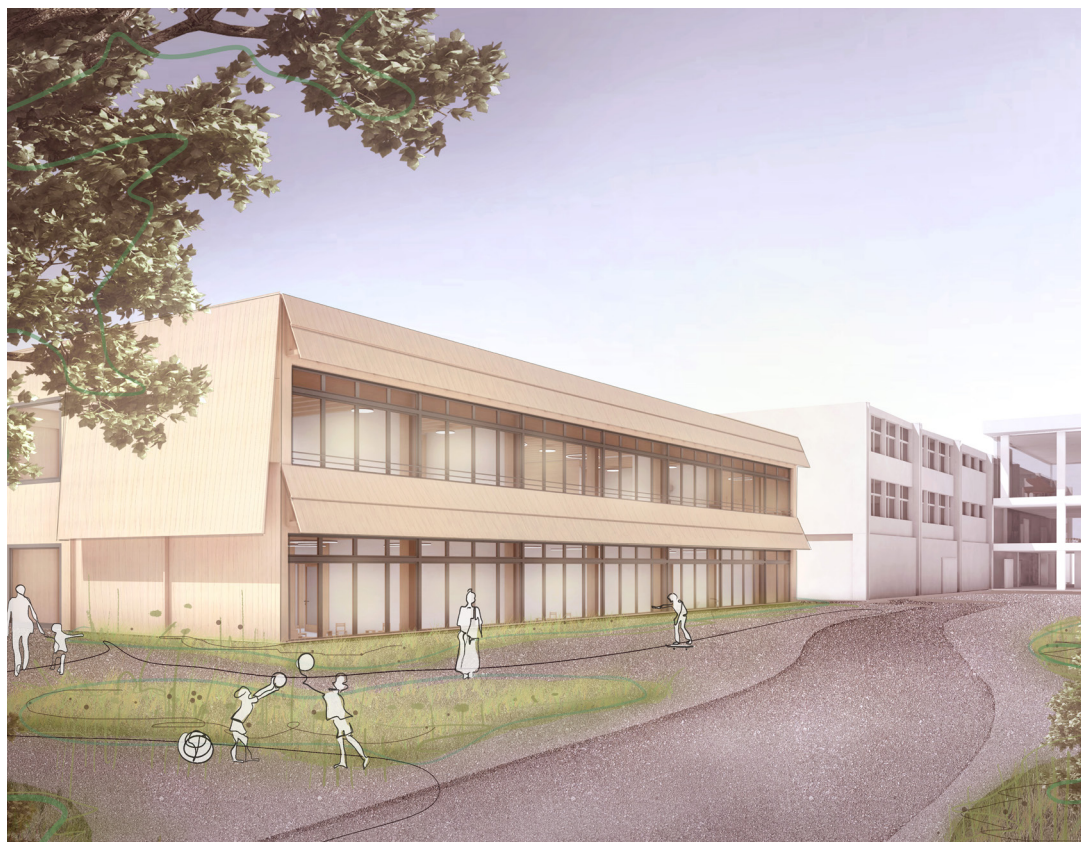
Visualisierung des sanierten Schulhauses Aegelmatt (in Planung)