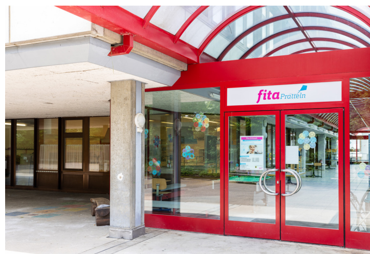
Fita Tagesstruktur im Erlimmatt