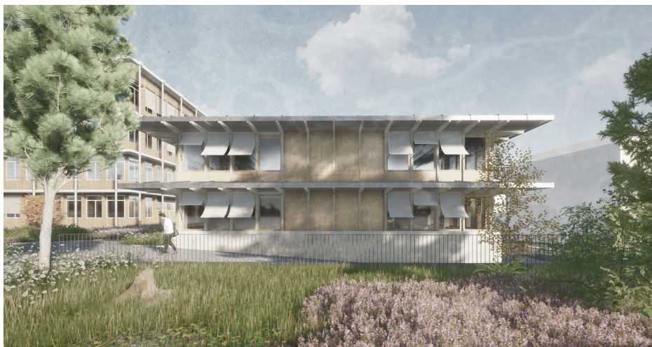
Visualisierung: Neues Gemeindezentrum