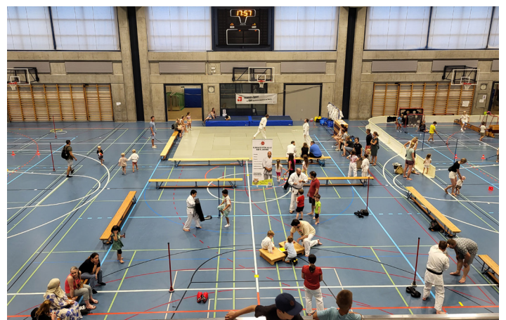
Prattler Sportnacht 2024