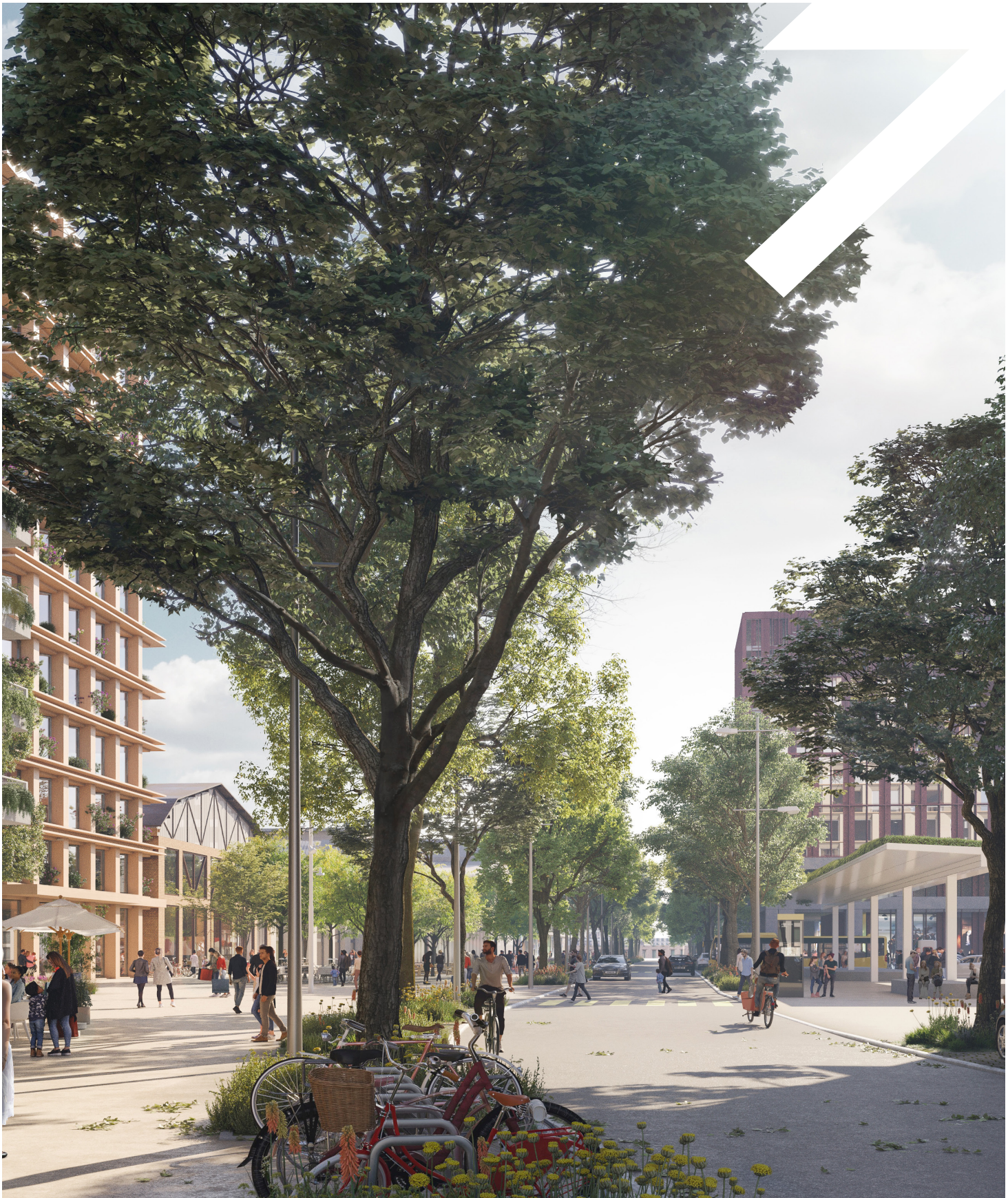
Visualisierung der neuen Bahnhofstrasse auf der Nordseite des Bahnhofs