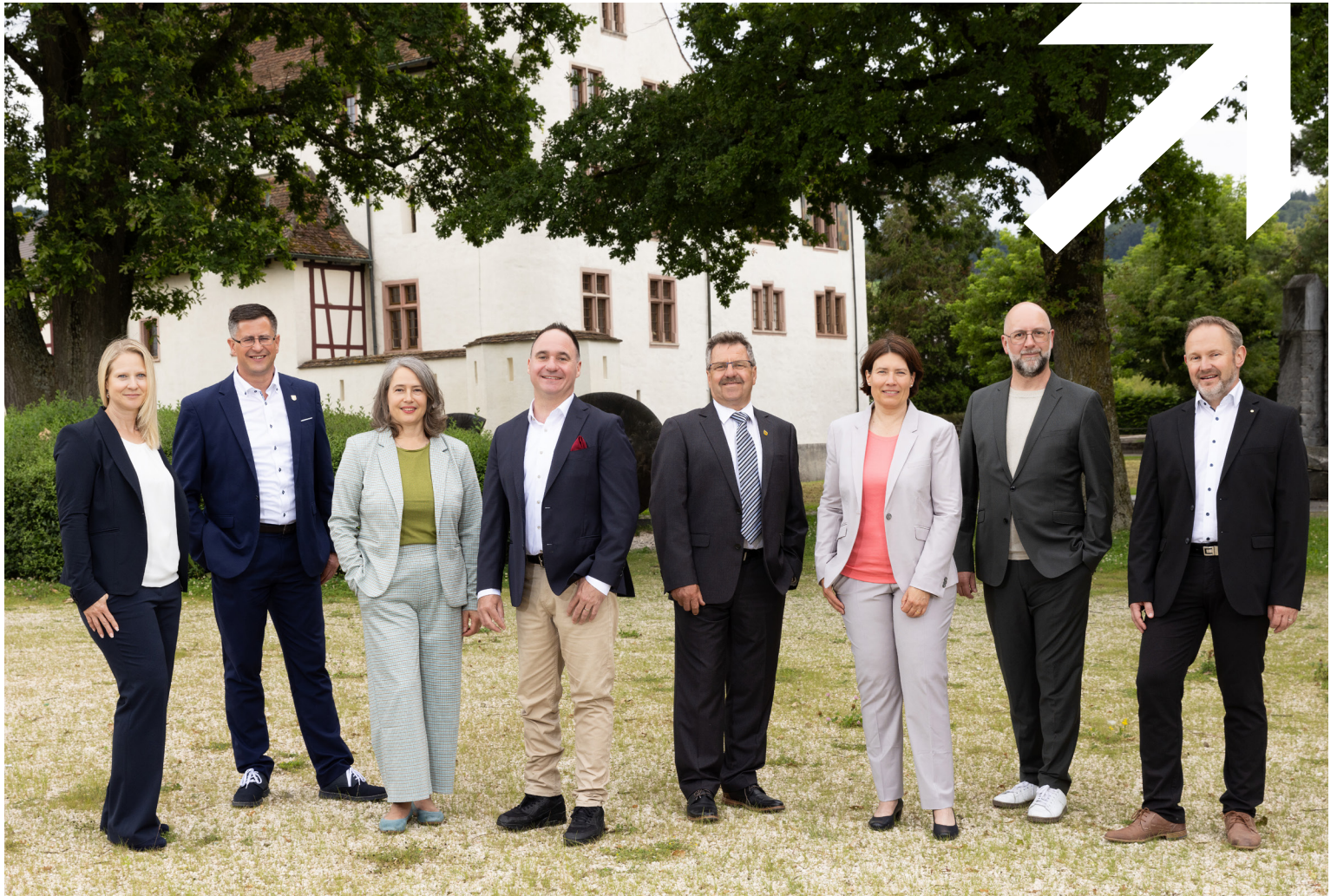
Gemeinderat in der Legislaturperiode 2024-2028